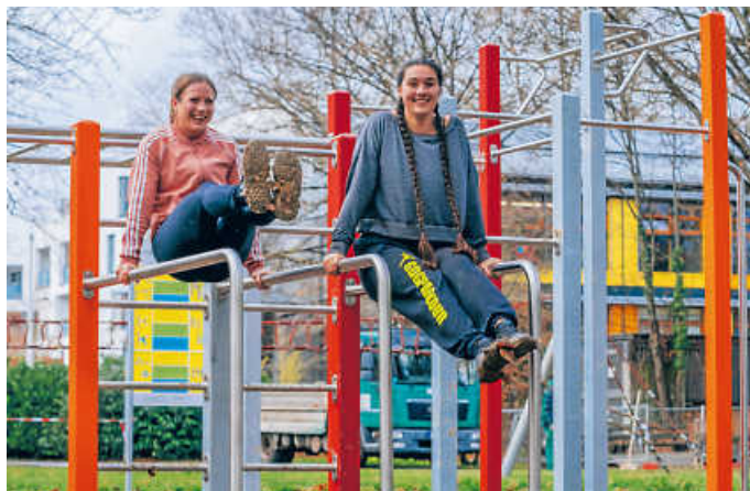
Die Calisthenics-Anlage ermöglicht Training im Freien.

Das Outdoor-Workout mit dem eigenen Körpergewicht ermöglicht ein funktionales Ganzkörpertraining aller wichtigen großen Muskelgruppen. Die Calisthenics-Anlage bietet +hierfür zahlreiche Trainingsmöglichkeiten. Horizontale Stangen, sogenannte Monkeybars, eignen sich für Klimmzüge. Am Barren können Dips, Ruder- und Bauchmuskelübungen absolviert werden. Die Bank empfiehlt sich für klassische Bauch- und Rückenübungen. Vertikale Stangen eignen sich für Bauchmuskel- und Dehnübungen, Fortgeschrittene können hier unter anderem die „Human Flag“, die „mensch-