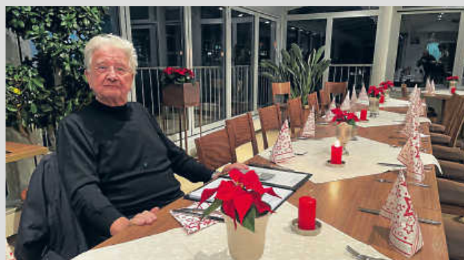
Hans Herrmann, eine deutsche Rennfahrer-Legende.

Der Mann, der zahlreiche Rennen gewann, war in der Formel 1 unterwegs, feierte große Erfolge in der Langstreckenweltmeisterschaft und gewann vor mehr als 50 Jahren das legendäre 24-Stunden-Rennen von Le Mans. „Ich habe über 300 Rennen gefahren“, sagt