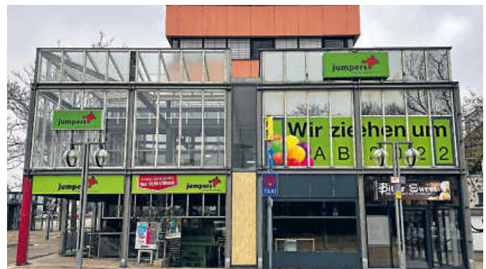
Aldi wird in das Untergeschoss im Berolinahaus einziehen.