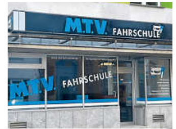
Filiale Epplestraße 34.