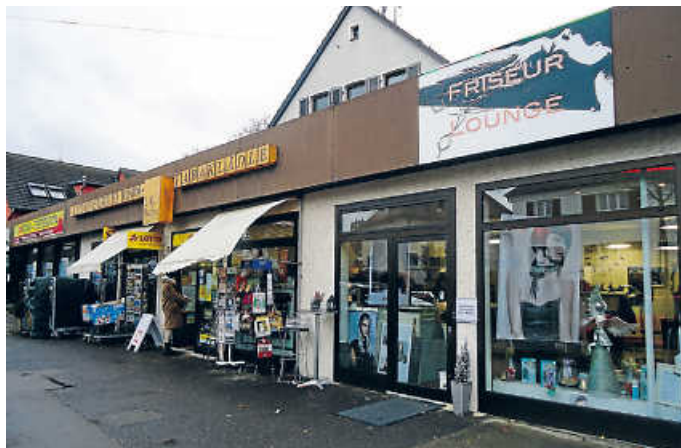
Immer weniger Fachgeschäfte verbleiben in Sonnenberg.

Elektro Lerch, BW-Bank, bald auch Postagentur/Papeterie und Friseur: Nach und nach schließen die Läden in Sonnenberg. Gleichzeitig stehen an der Laustraße wichtige Gewerbeobjekte leer. „Es ist schon fast skandalös, dass sich hier kein Mindestmaß an Nahversorgung darstellen lassen soll“, pointiert Neubarth. „Und dieses Thema geht uns alle an.“ Deshalb fordert Neubarth die EinwohnerInnen auf, sich in die Initiative Infrastruktur Sonnenberg einzubringen. Durch die Mobilisierung der Bürger soll vor allem auch die Aufmerksamkeit der Stadtverwaltung und anderer Entscheidungsträger erhöht werden. Auch außerhalb des Son-