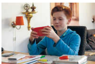
Mathe-Lerncheck.