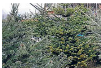
Hochzeit für Christbäume.

● Familie Stuber: Verkauf am Waldheim Weidachtal ab Freitag, 10. Dezember, Telefon 0151/58817240. Am Parkplatz Fernsehturm ab Montag, 13. Dezember, Telefon 0151/16346970. An beiden Standorten werktags von 10 bis 18 Uhr und sonntags von 11 bis 18 Uhr.