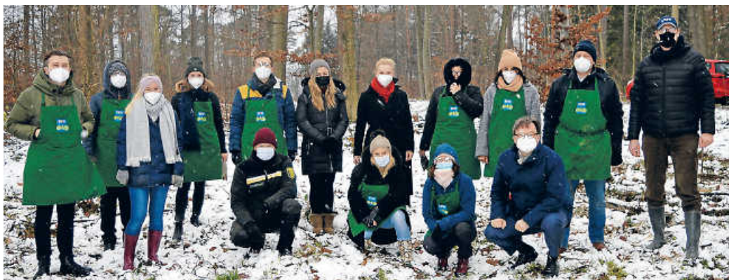
Für die Eichen-Pflanzung wurde eine Fläche am Königstraße Nähe Schönberg ausgewählt.