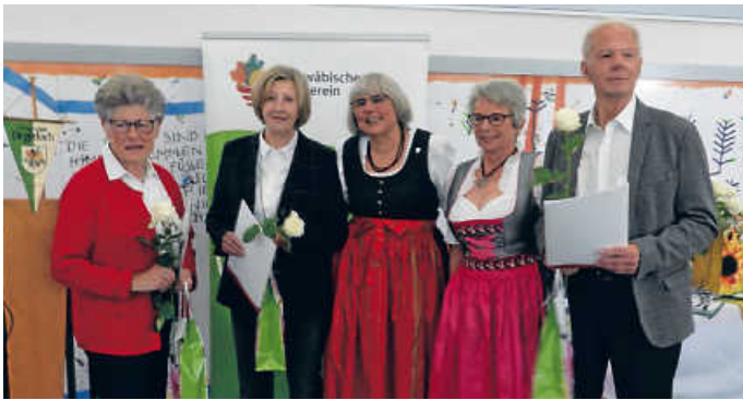
Neben einer Urkunde gab es eine Rose für die Mitglieder.