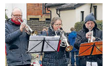
Posaunenchor in Aktion.