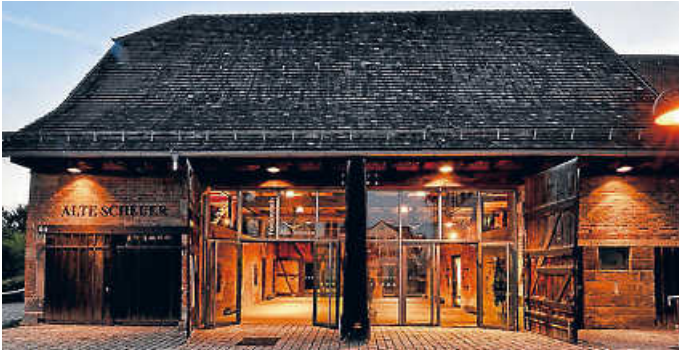
Treffpunkt für Vereine und Bürger am Agnes-Kneher-Platz.