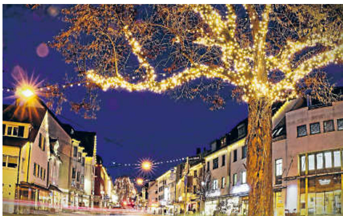
Blick vom Lindenplatz in die Epplestraße.

Möglich gemacht hat das auch eine finanzielle Zusage des örtlichen Bezirksbeirats in Höhe von 10.000 Euro aus dem Bezirksbudget. Eingeflossen in die Gesamtkosten von rund 21.500 Euro sind auch die in den GHV eingebrachten noch vorhandenen restlichen Finanzmittel der früheren GHV-Werbegemeinschaft. „Aufgrund der Pandemie gab es keine Aktionen – diese dafür vorgesehenen Gelder wurden eingespart und nun eingesetzt“, so Ehrle. Nachdem in diesem Jahr leider alle für die Öffentlichkeit gedachten GHV-Veranstaltungen ausfallen mussten, „soll die weihnachtliche Gestaltung des Degerlocher Haupteinkaufszentrums auch ein Dank an die Bürgerinnen und Bürger für ihre Treue zum Stadtbezirk sein“, bemerkt Klink. Ingo Kluge