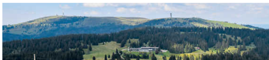
Blick vom Herzogenhorn auf den Feldberg

https://kaufinbw.net/schwarzwald-panoramaknife/