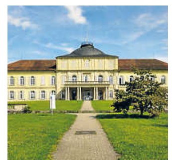
Schloss Hohenheim.

Heutzutage entscheiden nicht nur die eigenen Aufgaben und das direkte Arbeitsumfeld darüber, ob Beschäftigte einen Arbeitgeber als attraktiv wahrnehmen. Gute Karrierechancen, aber auch das soziale und gesellschaftliche Image sowie der Einfluss auf den Wirtschaftsstandort spielen bei der Beurteilung eine Rolle.