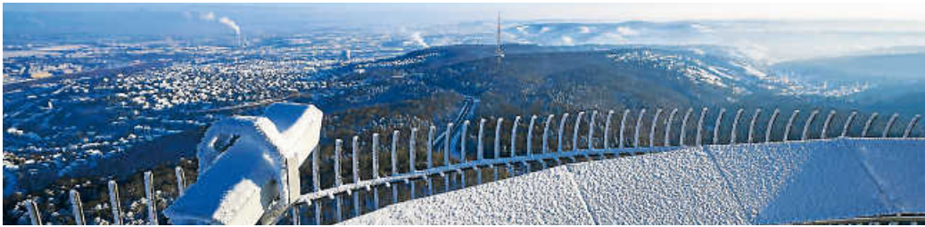
Winteraussicht in die Region vom Stuttgarter Fernsehturm auf der Waldau.